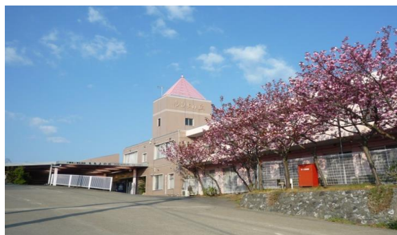
特別養護老人ホーム ももよの丘