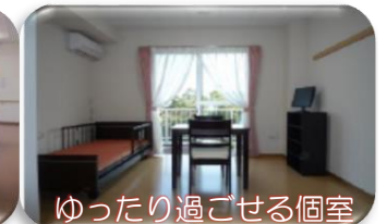
ゆったり過ごせる個室