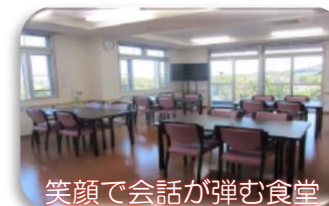
笑顔で会話が弾む食堂