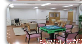
様々なレクが楽しめる娛樂室